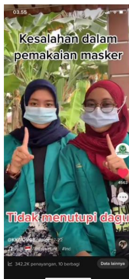
Gambar 3. Konten kesalahan dalam pemakaian masker