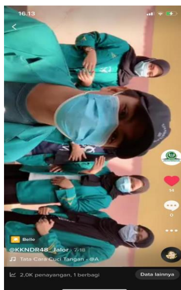
Gambar 2. Konten cara mencuci tangan