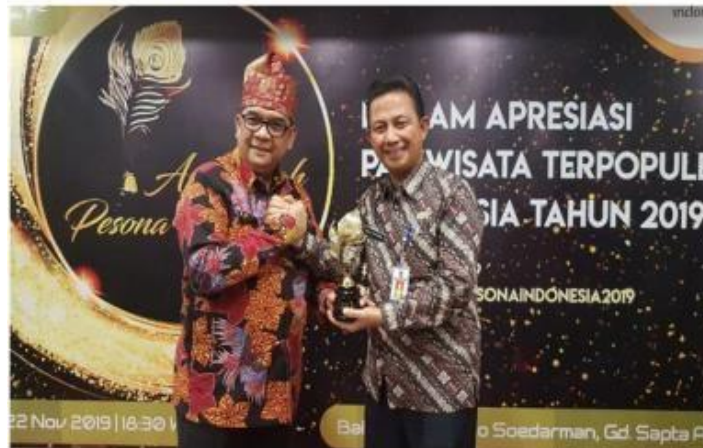
Gambar 1 Penghargaan Api Awards 2019 wisata gulamo

Karena memiliki potensi alam yang sangat indah dan masih asri dan berbagai potensi lainnya yang dimiliki oleh wisata ini. Maka, pada momentum API (Ajang Penghargaan Indonesia) 2019 dimana lima destinasi wisata di Riau menerima apresiasi dalam Anugerah Pesona Indonesia 2019 dan salah satunya adalah Wisata Gulamo meraih penghargaan dari API (Ajang Penghargaan Indonesia) Awards 2019 pada peringkat ke 3 kategori surga tersembunyi yang dilaksanakan oleh Konsultan Pariwisata dan Kementerian Pariwisata Ekonomi Kreatif. (Kamparkab.go.id)