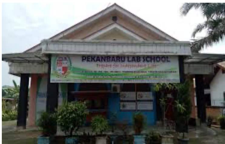
Gambar 1. Sekolah Pekanbaru Lab School

Peserta Didik atau anak autis yang ada di sekolah Pekanbaru Lab School dengan jumlah 30 orang anak penyandang autis dengan bermacam gejala yang dialami oleh anak autis tersebut.