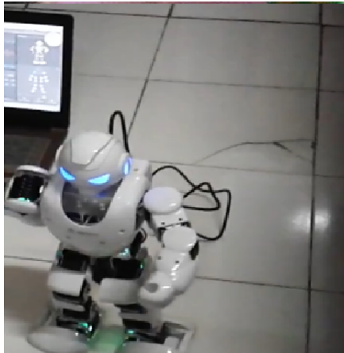
Gambar 5 Tampilan Robot Humanoid

Media terapi merupakan salah satu paling utama dalam proses pembelajaran dengan jenis terapi yang ada. jenis terapi begitu banyak untuk penanganan anak autis, maka media atau alat terapi tentu menyesuaikan dengan jenis terapi. Media dan alat terpai masih banyak kelemahan dan masih banyak kekurangan serta media terapi belum menyentuh unsur teknologi.