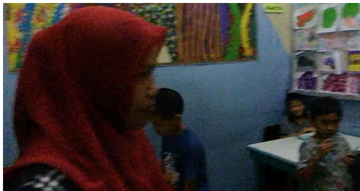
Gambar 4. Pendampingan yang dilakukan oleh guru pembimbing