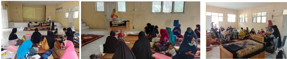
Gambar 2. Penyuluhan kegiatan pengabdian masyarakat

Penyuluhan keempat dilaksanakan pada tanggal 14 Juni 2021 yaitu mengenai pijat bayi pada anak usia 0-18 bulan. Pada pertemuan keempat pemberian materi dengan menggunakan metode ceramah, power point, pemutaran video mengenai pijat bayi dan praktik pijat bayi pada phantom. Pada penyuluhan keempat selain pemberian materi dan praktik pijat bayi dilakukan juga posttest mengenai pengetahuan ibu mengenai tumbuh kembang anak usia 0-18 bulan. Posttest keterampilan ibu dalam melakukan pijat bayi dilakukan pada tanggal 17-19 Juni 2021 dengan melakukan kunjungan ke rumah.