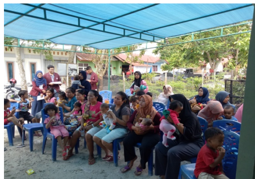
Gambar 3. Peserta Kegiatan Sosialisasi Pentingnya ASI Eksklusif Pada Bayi