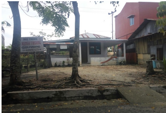
Gambar 2. Posyandu Bunga Tanjung

usia subur, ibu-ibu yang memiliki bayi usia 0-24 bulan, serta ibu hamil dapat memberikan ASI kepada anaknya.