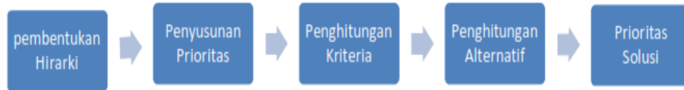
Gambar 1. Tahapan Dalam AHP

sebagai suatu representasi dari sebuah permasalahan yang kompleks dalam suatu struktur multi level dimana level pertama adalah tujuan, yang diikuti level faktor, kriteria, sub kriteria, dan seterusnya ke bawah hingga level terakhir dari alternatif. Untuk mendapatkan keputusan yang rasional dengan menggunakan AHP, perlu melakukan beberapa tahapan. Secara garis besar tahapan dalam AHP dimodelkan oleh gambar berikut: